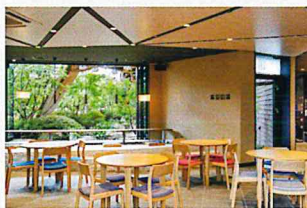
4 エントランス&カフェ カフェや休憩にご利用ください。