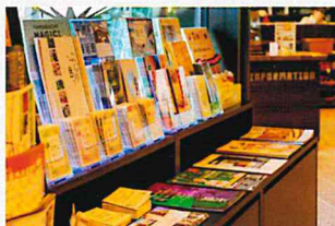
6 パンフレットコーナー 山口のイベントや観光に関するパンフレットをご自由にお持ち帰りいただけます。旅のプラン作りにご利用ください。気になることはお気軽にスタッフにお尋ねください。