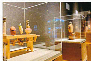
5 1階展示スペース 山口に関する展示があります。