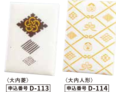
〈大内菱〉 申込番号 D-113 〈大内人形〉 申込番号 D-114