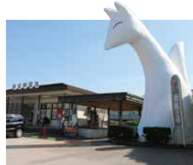
JR湯田温泉駅にある高さ8m、重さ3トンの巨大な白狐のモニュメント。フォトスポットとして観光客に人気。湯田温泉の「白狐伝説」にちなみ設置された。

山口県を代表する温泉の二つ「湯田温泉」は、肌によく馴染むやわらかい湯が特徴のアルカリ性単純泉の「美肌の湯」。また、1日に2000トンが湧き出る豊富な湯量を誇る。そんな湯田温泉は、今から約800年前に白い狐が足を浸