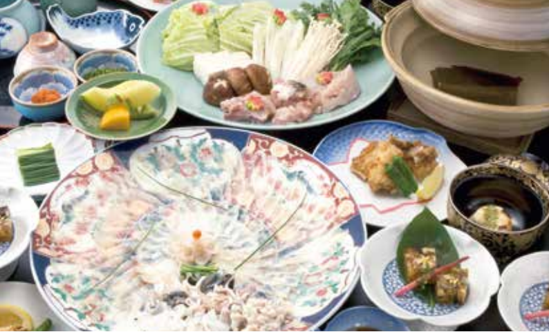
「活き天然とらふくコース」山口県産の天然とらふくを堪能できる本格的コース(全7品)