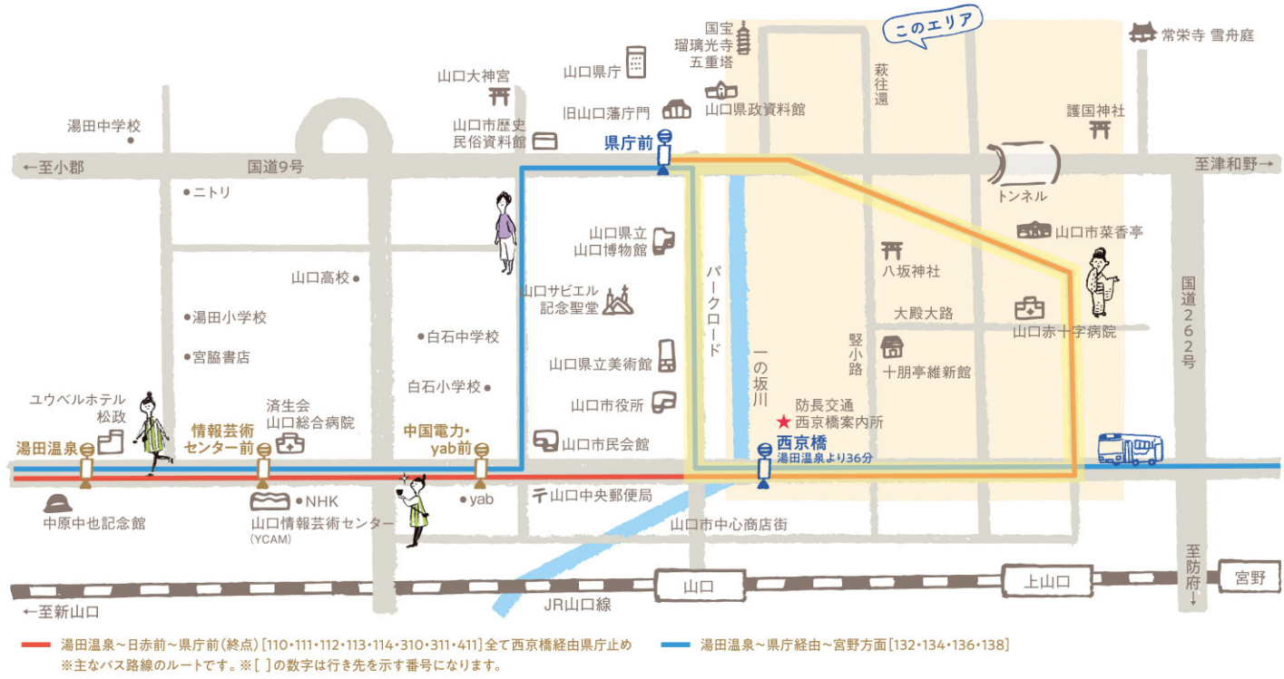
— 湯田温泉～日赤前～県庁前(終点) [110・111・112・113・114・310・311・411] 全て西京橋経由県庁止め — 湯田温泉～県庁前～西京橋案内所 [132・134・136・138] 全て西京橋経由 ※主なバス路線のルートです。※ [ ] の数字は行き先を示す番号になります。